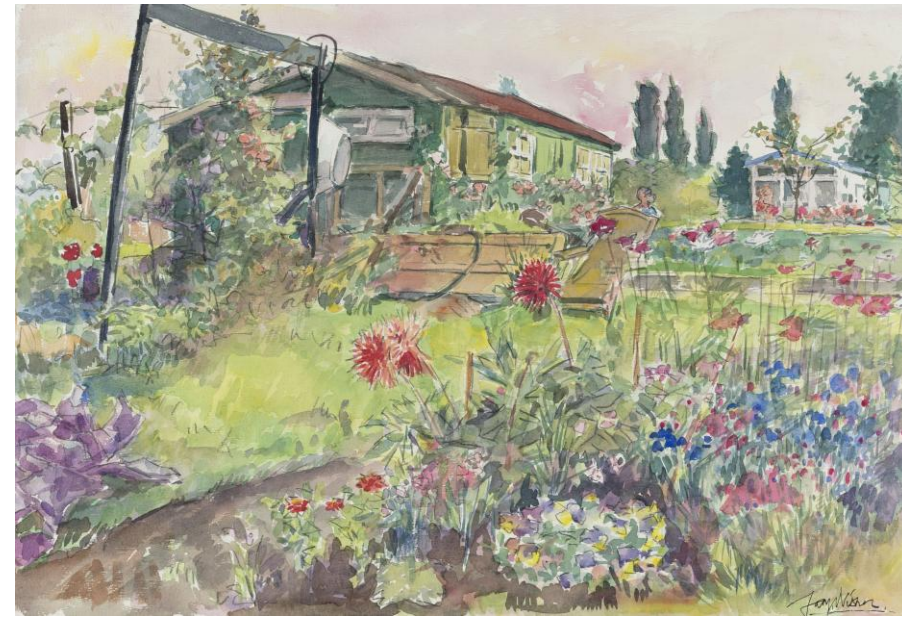
Tekening door Jaap Visser, 1965